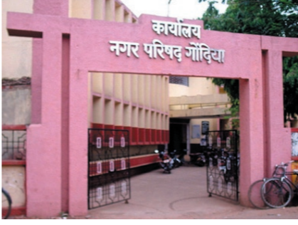
भागात १४१ किमी आणि उत्तर भागात १२५ किमी लांबीचे गटार निर्माण करण्याचा घाट आहे.

गोंदिया- शहरात भूमिगत गटार योजनेचे काम सुरु करण्याचेच प्रयत्न होतांना दिसून येत नाहीत. संख्येने मोठ्या असलेल्या दक्षिण भागात पूर्वी काम सुरु करण्याचे नियोजन फसले असून उत्तर भागाचे काय होईल हेच कळनासे झाले आहे. शहराच्या दोन्ही भागात मिळून २३९.६८ कोटी रुपयाची भूमिगत गटार योजनेला मंजूरी देण्यात आली आहे. त्यातून १३४.०७ कोटीची योजना शहराच्या दक्षिण भागाकरीता आहे तर ११७.७२ कोटी रुपयाची भूमिगत गटाराची योजना उत्तर भागाकरीता आहे. पहिल्या योजनेचे काम पूर्ण झाल्यानंतरच दुसऱ्या योजनेच्या कामाची सुरुवात करण्यात येईल असे ठरले आहे. पण पहिल्याच योजनेचे काम तीन वर्षे पूर्ण झाल्यानंतर अजूनही सुरु झाले नाही. त्यामुळे हे काम केंद्रा पूर्ण होणार हेच काही सांगता येत नाही. म्हणूनच उत्तर भागातील काम केंद्रा सुरु होतील हे ही काहीच सांगता येत नाही. दक्षिण