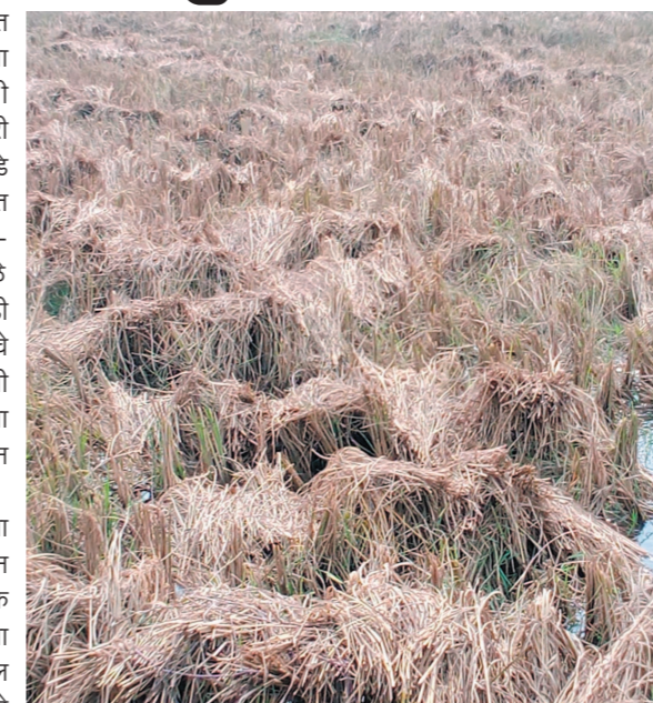
असल्याची चिंता शेतकऱ्यांमध्येच निर्माण झाली आहे. पुढील दोन दिवस जिल्ह्यात दगाळी वातावरण आणि अधून-मधून पावसाच्या सरी बरसणार असल्याचा अंदाज हवामान विभागाने वर्तविला आहे. अवकाळी पाऊस पेर-णी झालेल्या पिकांना फायदाच असला तरी तो तूर, हरभरा, पोपट आदी पिकांसाठी हानिकारक असल्याचे जाणकारांचे म्हणणे आहे.

परिसरात मोठ्या प्रमाणावर शेतकरी धान उत्पादक आहेत,अचानक निसर्गाच्या झालेल्या ओल्या मारा मुळे शेतकरी हतबल झाले आहेत.या पावसाने शेतकऱ्यांमध्ये धडकी भरविली आहे. सध्या रबी पिकांचा हंगाम सुरु असून पेरणी सुरु आहे तर अनेक ठिकाणी खरीप हंगामातील धानाची कापणी आटोपली असून धानाच्या पेंड्या बांधण्याचे काम सुरु आहे. पावसामुळे शेतकऱ्यांचे धान कडचे व मळणीसाठी रचून ठेवलेले पुंजने पाण्यामुळे भिजले. यामुळे शेतकऱ्यांमध्ये धानाची पत खराब होणार