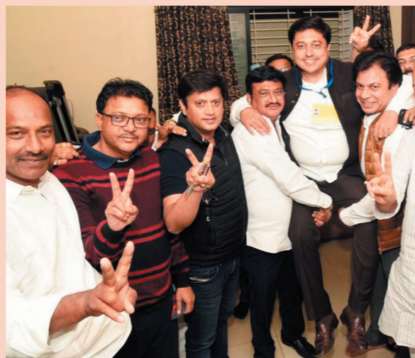
नागपूर पदवीधर मतदारसंघ हा भाजपचा गड आहे. येथे महाविकास आघाडीने भाजपच्या गडाला सुरुंग लावला आहे.