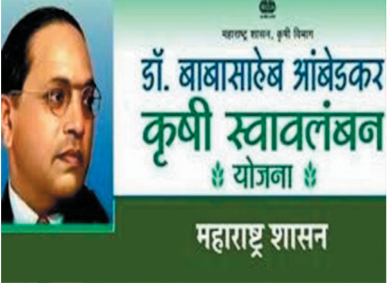
डॉ. बाबासाहेब आंबेडकर कृषी स्वावलंबन योजना

गोंदिया: गत काळातील भाजपा सरकारने अनुसूचित प्रवर्गातील शेतकऱ्यांच्या आर्थिक उत्थानासाठी राज्य शासनाच्या कृषी विभागामार्फत डॉ. बाबासाहेब आंबेडकर कृषी स्वावलंबन योजना सुरु केली होती. मात्र विद्यमान महाविकास आघाडी सरकारने कोरोनामुळे ही योजना न राबविण्याचे ठरवित राज्य शासनाच्या कृषी विभागाने यासंदर्भातील आदेश जारी केले आहे. यामुळे गोंदिया जिल्ह्यातील शेकडो शेतकरी या योजनेच्या लाभार्थी असून वंचित राहणार आहेत. मागासवर्गीय शेतकऱ्यांच्या जीवनात आमूलाग्र परिवर्तन आणणारी ही योजना असून गेल्या दोन वर्षांपासून ही योजना जिल्हा परिषदेमार्फत राबविण्यात येत आहे. अनुसूचित जाती प्रवर्गातील ५ हेक्टर शेती असलेल्या शेतकऱ्यांना अडीच लाख रुपये विहीरीसाठी या योजनेचा लाभ देण्यात येतो. सोबतच २५ हजारपर्यंत कृषी पंप व १० हजार रुपये वीज जोडणीसाठी, जुनी विहीर दुस्स्तीसाठी ५० हजार, विहीर त्रिभोअर करण्यासाठी २० हजार, शेततळ्यात प्लॅस्टिक अस्तीकरणसाठी १ लाख रुपयाचे अर्थसहाय्य देण्यात येते. यासाठी उत्पन्नाची वार्षिक दीड लाखांची मर्यादा घालून दिली आहे. ही योजना १०० टक्के शासन अनुदानाची आहे. गोंदिया जिल्ह्यात दरवर्षी ३०० ते ४०० शेतकरी या योजनेसाठी अर्ज करतात. शासनाने उपलब्ध करून दिलेल्या अनुदानाच्या तुलनेत लाभार्थी निवड करण्यात येते. साधारणतः २०० लाभार्थी शेतकरी या योजनेसाठी पात्र ठरतात. काही दिवसांपूर्वी या योजनेचे आभासी प्रणालीच्या मध्यमातून पात्र लाभार्थींकडून अर्ज मागविण्याची प्रक्रिया सुरु करण्यात