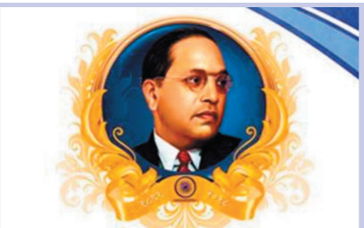
डॉ. बाबासाहेब आंबेडकर समता प्रतिष्ठान (महाराष्ट्र शासनाच्या सामाजिक न्याय व विशेष सहाय्य विभागाचा सार्वजनिक उपक्रम)

नागपूर: बार्टच्या अधीनस्थ असलेल्या डॉ. बाबासाहेब आंबेडकर समता प्रतिष्ठान संस्थेमध्ये आर्थिक गैरव्यवहार आढळल्याने सामाजिक न्याय खात्याचे प्रधान सचिव यांच्या अध्यक्षतेखाली चौकशी केली जाणार आहे. समता प्रतिष्ठानला गेल्या तीन वर्षांत दिलेल्या १६ कोटी रुपये खर्चाचा हिशेब देता आला नाही. तसेच निविदा न काढता काम दिले गेले किंवा निविदा प्रक्रिया चुकीच्या पद्धतीने राबवल्याचा ठपका ठेवण्यात आला आहे. यासंदर्भातील तक्रारींनंतर सामाजिक न्यायमंत्री धनंजय मुंडे यांनी याप्रकरणी चौकशीचे आदेश दिले. त्यानुसार या संस्थेच्या संपूर्ण कारभाराची चौकशी होणार आहे. समतादूत प्रकल्पावर