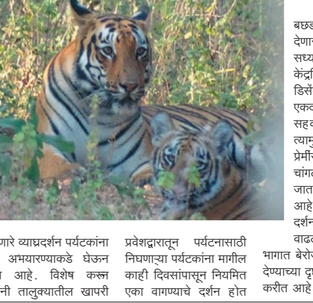
होणारे व्याघ्रदर्शन पर्यटकांना या अभयारण्याकडे घेऊन येत आहे. विशेष करून पवनी तालुक्यातील खापरी

पवनी, -अभयारण्यात पर्यटनाला निघाल्यानंतर व्याघ्र दर्शन व्हावे हीच इच्छा प्रत्येकाच्या मनी असते. सध्या अशी इच्छा मनात धरून उमरेड कऱ्हांडला अभयारण्यातील पवनी खापरी प्रवेशद्वाराने पर्यटन पर्यटनासाठी निघणाऱ्या पर्यटकांची इच्छापूर्ती होत आहे. एक वाघिणी तिच्या बसण्याचा नियमित दर्शन देत असल्याने पर्यटकांचा ओढा ही या दिशेने वाढला आहे. उमरेड कऱ्हांडला पवनी अभयारण्याची कीर्ती सध्या पसरू लागली आहे. दिवसेंदिवस अधिक प्रमाणात