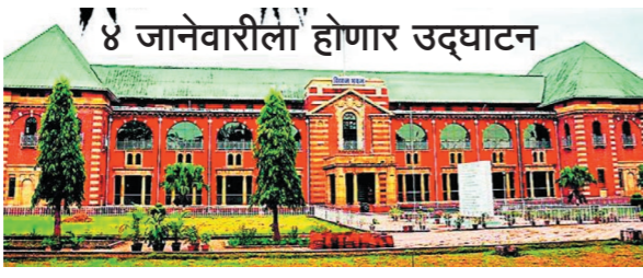
४ जानेवारीला होणार उद्घाटन

अधिवेशनासाठी वारंवार कर्मचारी व इतर बाबी मुंबईवरून हलविण्यात होत असलेला त्रास व आर्थिक खर्चाचा विचार करून विधानसभा अध्यक्ष नानाभाऊ