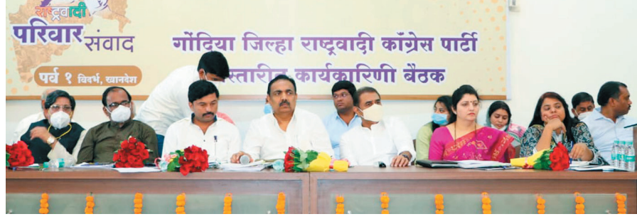
आपण परिवार संवाद दौऱ्यानिमित्त पक्ष कार्यकर्त्यांच्या

भेटीला आले आहेत. राष्ट्रवादी काँग्रेस पक्ष हा आमचे नेते खा.शरद पवार यांच्या विचारांचा पक्ष आहे. या पक्षात कार्यकर्ती हा केंद्रबिंदू मानला जातो. म्हणून कार्यकर्त्यांनी पक्ष बळकटीसाठी कामाला लागावे. विदर्भात आपल्या पक्षाचे आमदार कमी असले तरी सर्वजण जिल्ह्यात तळगाळपर्यंत पक्षाचे जाळेमुळे आहेत. त्यामुळे पक्ष कार्यकर्त्यांनी