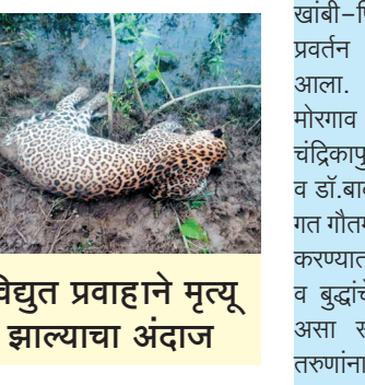
विद्युत प्रवाहाने मृत्यू झाल्याचा अंदाज

पालोरा - कोका वन्यजीव अभयारण्याला लागून असलेल्या गावाबाहेरील एका बोडीत रविवारी सहा वर्षीय नर बिबट्याचा मृतदेह आढळून आल्याने वनविभागात खळबळ उडाली आहे. वनकर्मचारी व पशुवैद्यकीय अधिकाऱ्यांच्या उपस्थितीत बिबट्याचा शवविच्छेदन करून येथील विश्रामगृह परिसरात दाहसंस्कार करण्यात आला.