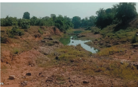
गोंदिया, -गोरेगाव, गोंदिया आणि आमगाव तालुक्यातील १०० पेक्षा अधिक गावांसाठी पांगोली नदी जीवनदायिनी आहे. मात्र गेल्या काही वर्षांपासून नदीचे पात्र अस्वस्थ झाले आहे. ठिकठिकाणी झुडपे वाढली. अनेक ठिकाणी नदीच्या पात्रांत अतीकमण झाले. त्यामुळे नदीचे अस्तित्व धोक्यात आले. वर्षातून केवळ तीन महिनेच नदीत पाणी असते. नदीला पुनर्जिवीत करण्याची मागणी होत आहे. जिल्हा प्रशासनाने देखील खोलीकरणाचा प्रस्ताव तयार केला. तो प्रस्ताव केंद्र शासनाकडे पाठविण्यात आला आहे. मात्र अद्यापही खोलीकरणाला मंजूरी मिळाली नसल्याने नदीला गतवर्षभरासाठी पुन्हा किती वाट बघावी लागणार, असा सवाल उपस्थित होत आहे. पांगोली नदीचा उगम गोरेगाव असल्याचे म्हटले आहे.