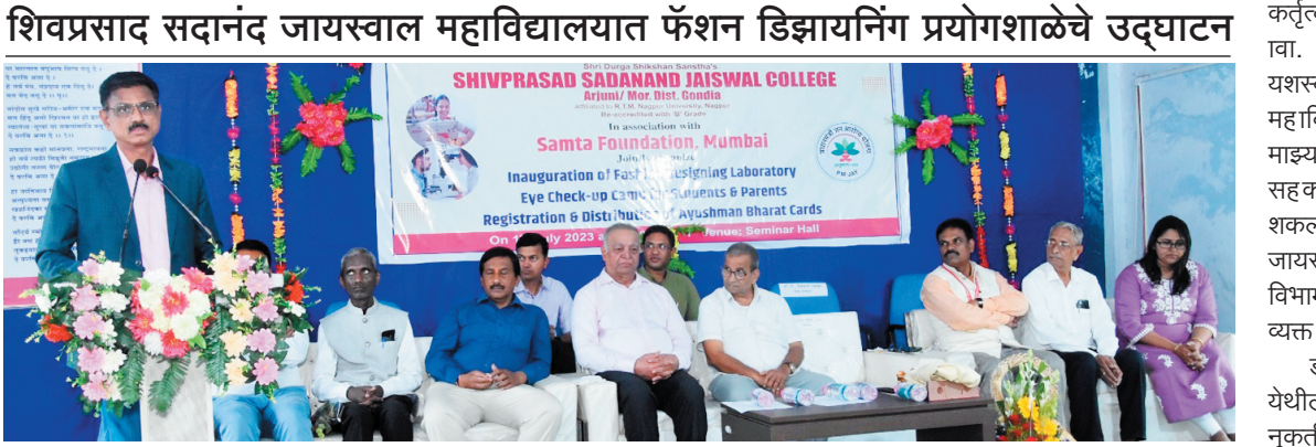
शिवप्रसाद सदानंद जायस्वाल महाविद्यालयात फॅशन डिझायनिंग प्रयोगशाळेचे उद्घाटन