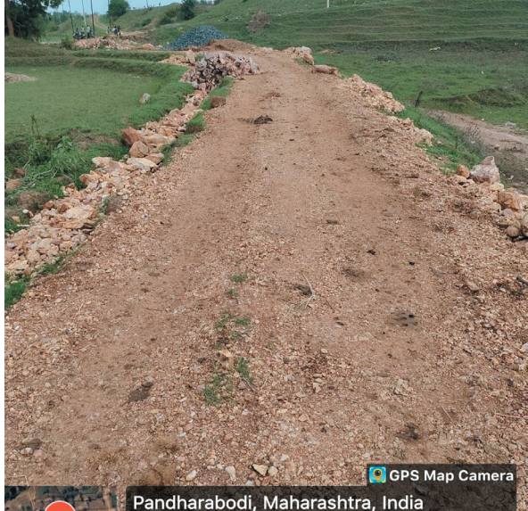
Pandharabodi, Maharashtra, India