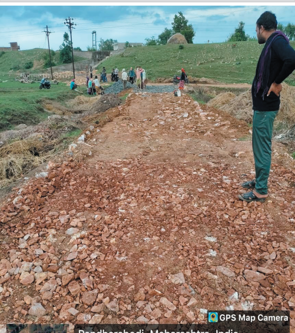
Pandharabodi, Maharashtra, India

गुदमा येथे ही मग्नारोहोची दिरंगाई गुदमायेथे मग्नारोहोत मुख्य नहरपासून पांढण रस्त्याचे काम करण्यात आले. या कामासाठी ३० लाखांचा निधी मंजूर केला होता. दरम्यान काम दर्जेदार होणार, अशी अपेक्षा गावकऱ्यांना होती. पण शासकीय नियमांना वेशीवर टांगून निकृष्ट दर्जाचे काम करण्यात आले. कामात वापरले जाणारे साहित्य दर्जाहीन होते. यामुळे कामाची गुणवत्ता ढासळल्याचे गावकऱ्यांच्या निदर्शनास आले. त्यामुळे या कामाची चौकशी करून न्याय देण्याची मागणी गावकऱ्यांनी केली आहे.