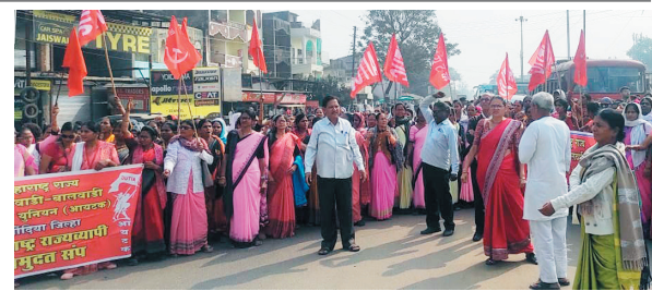
पूर्ण न झाल्यास आंदोलन अधिक तीव्र करण्याचा इशारा देण्यात आला.

रुंदीचा पूल डिसेंबर २०२२ मध्ये पूर्णत्वास आला. विशेष म्हणजे विदर्भातील हा पहिला केबल पूल आहे. या पुलाच्या परिसरात पर्यटकांना आकर्षित करण्यासाठी दोन बाजूला फुटपाथ, पॅनोरमिक लिफ्ट आणि जिने आहेत. या पुलावरून चैतन्येश्वर मंदिर परिसरासह आसपासच्या क्षेत्रातील उकृष्ट दृश्य पर्यटकांना पाहता येणार आहेत.