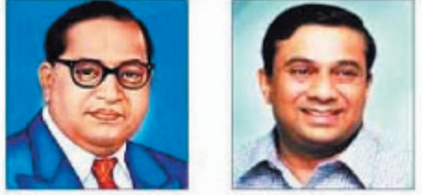
डॉ. बाबासाहेब आंबेडकर

वास्तविक, पहिल्या टप्प्यात या योजनेचे पाणी नवेगावबांध्याच्या जलाशयात सोडण्याचे होते.ते २९ मे २३ रोजीच पूर्ण झाले. टप्पा २ रोजी आलेल्या या वनविभागाच्या अडचणी आलेल्या होत्या, त्या