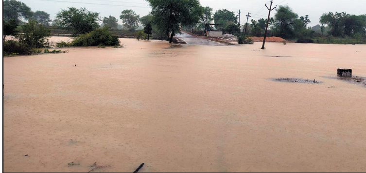
तिरोंडा तालुक्यातील घाटकुरोडा-घागरा व अर्जुनी ते गोंडमोहाडी-किडगीपार नाल्यावरील पुलावरून पाणी वाहत असल्याने रस्ता वाहतुकीकरिता बंद झालेला आहे.