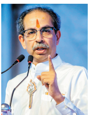
मुंबई:- विधीमंडळाचं पावसाळी अधिवेशन सुरु आहे. मात्र या अधिवेशनात देखील विरोधी पक्षनेतेपद रिक्त आहे. महाविकास आघाडीला ते मिळावं अशी अपेक्षा आहे. मात्र ते अद्याप ही विधानसभा अध्यक्ष यांनी दिलेलं नाही. वारंवार पत्र देऊन देखील अध्यक्ष विरोधी पक्षनेतेपद विरोधकांना देत नसल्याची भावना मविआमध्ये आहे. त्यासाठी आता शिवसेना उद्भव बाळासाहेब ठाकरे पक्ष विधानसभेत आक्रमक होणार आहे. या पाश्चिमीवर पक्षप्रमुख उद्भव ठाकरेनी आमदारांची बैठक घेतली. या बैठकीत त्यांनी विरोधी पक्षनेतेपदासाठी विधानसभेत आक्रमक व्हा असे आदेश दिले. शिवसेना पक्षप्रमुख उद्भव ठाकरेनी पक्षातील आमदारांची बैठक घेतली. विरोधी पक्षनेतेपद अजून ठाकरे गटाला का मिळालं नाही याची चर्चा झाली. त्याबद्दल सभागृहात प्रश्न का उपस्थित केले जात नाहीत असा प्रश्न त्यांनी सर्वांसमोर उपस्थित केला. याअ-

दिल्या आहेत. दरम्यान यावेळी अधिवेशनात आमदारांच्या काम गिरीचा आढावा ही यावेळी उद्भव ठाकरे यांनी घेतला. रोज सकाळी विरोधी पक्षांचे विधीमंडळाच्या पायांचा आंदोलन होतं. पण ते ज्या पद्धतीनं व्हायला पाहीजे ते होत नाही याबाबतही उद्भव यांनी नाराजी व्यक्त केल्याचं समजत आहे. गेल्या काही दिवसांपासून विधीमंडळाच्या पायांचा व्हाणार हा-तावर मोजण्या इतके विरोध आंदोलन करत आहेत. शिवसेना उद्भव बाळासाहेब ठाकरे पक्षाचे आमदार या आंदोलनास उपस्थित का राहत नाहीत असा देखील सवाल उद्भव ठाकरे यांनी ठाकरे यांनी सांगितला. उद्यापासून सर्व आमदारांना आंदोलनास उपस्थित राहून विरोधकांचे प्रश्न कठोरपणे मांडण्याच्या सूचना उद्भव ठाकरेनी दिल्या आहेत. या बैठकीनंतर शिवसेना ठाकरे गटाच्या आमदारांचे नवे रूप सभागृहात आणि सभागृहा बाहेर बघायला मिळेल असे बोललं जात आहे.