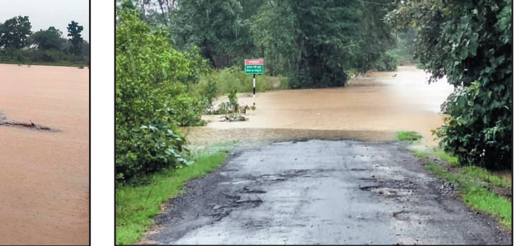
महागावगांला तडे पडले, यामुळे वाहनगांराच्या जीवितास धोका निर्माण झाला आहे.

धापेवाडा बरेजचे सर्व २३ दरवाजे उघडले गोंदिया- जिल्ह्यात पावसाचा जोर कायम असून हवामान विभागाने पुढील दोन दिवस मुसळधार पावसाचा इशारा दिला आहे. नदी नाले दुधडी भरून वाहत आहेत. तर धरणातून सुद्धा मोठ्या प्रमाणात पाण्याचा विसर्ग सुरु आहे. (दि.८) दुपारी तिरोंडा तालुक्यातील वैनगंगा नदीवरील धापेवाडा बरेजचे संपुर्ण २३ दरवाजे उघडण्यात आले. यातून १ लाख ८३ हजार क्युसेकने पाण्याचा विसर्ग सुरु होत आहे. जोरदार पावसामुळे वैनगंगा नदीच्या पाणी पातळीत वाढ झाली आहे त्यामुळे बरेजमधून पाणी सोडण्यात येत आहे. नदीकाठच्या गावातील नागरिकांना सतर्कतेचा इशारा प्रशासनाने दिला आहे. जिल्ह्यातील गोंदिया ७९.२ मिमी, आमगाव ५३.२ मिमी, तिरोंडा १२० मिमी, गोंदगाव ५९.५ मिमी, सालेकसा ७५.७ मिमी, देवरी १९८ मिमी, अर्जुनी मोरगाव २०६.९ मिमी, सडक अर्जुनी ७४.० मिमी असे एकूण ११०.६ मिमी पावसाची नोंद करण्यात आली आहे.