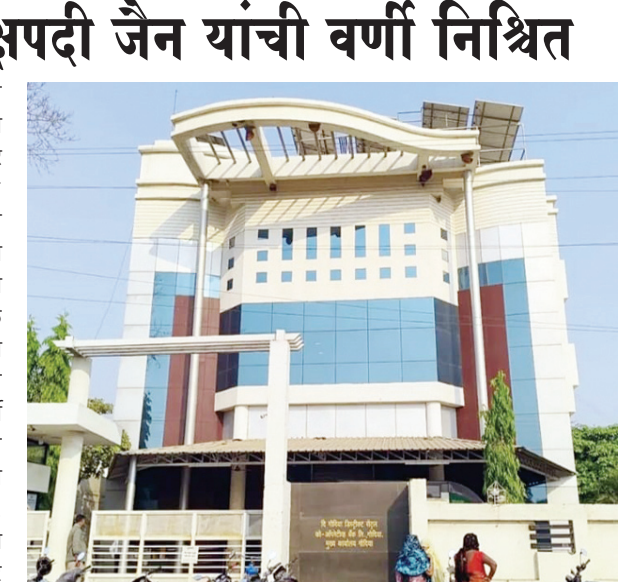
जिल्हा बँक निवडणुकीत परिवर्तन पॅनलचे ९ संचालक निवडून आले. मात्र यापैकी दोन संचालकांनी सहकार पॅनलला आपले समर्थन जाहीर केले. त्यामुळे परिवर्तन पॅनलच्या संचालकांची संख्या ७ वर आली आहे. पण यानंतरही त्यांनी अध्यक्षपदासाठी मोर्चेबांधणीला सुरुवात केल्याचे चित्र आहे.