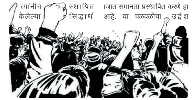
त्यांनीच केलेल्या स्थापित सिद्धार्थ जागत समानता प्रस्थापित करणे हा आहे. या चळवळीचा उद्देश

स्वाभिमानाला प्राधान्य देवून डॉ. बाबासाहेब आंबेडकरांनी आपले समग्र आंदोलन चालवले. जेथे माणसाचे माणुसपण नाकारले जाते त्या हिंदू धर्माच्या (ब्राह्मणी धर्म) ठेकेदारांना त्यांनी अनेक प्रश्न केलेत. अशा वेळी आपल्या लोकांनाही त्यांनी सावध केले. वेळ प्रसंगी कान सुद्धा पिळलेत. त्यांना एक आदर्श समाज निर्माण करायचा होता. त्यासाठी त्यांनी आपले सर्वस्व त्याला लावले. जाती व्यवस्था कायम ठेवून ते करणे शक्य नव्हते. त्यासाठी त्यांच्या अनुयायांनी जीवाची बाजी लावली अशी त्यांची अपेक्षा होती. १७ आगस्ट १९५२ ला