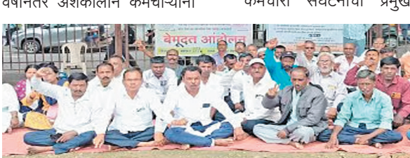
नियमित सेवेची संधी मिळाली.