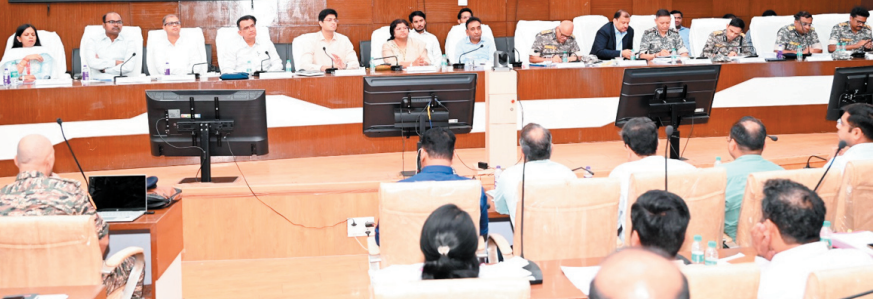
गडचिरोली येथे राज्यस्तरीय आढावा बैठक